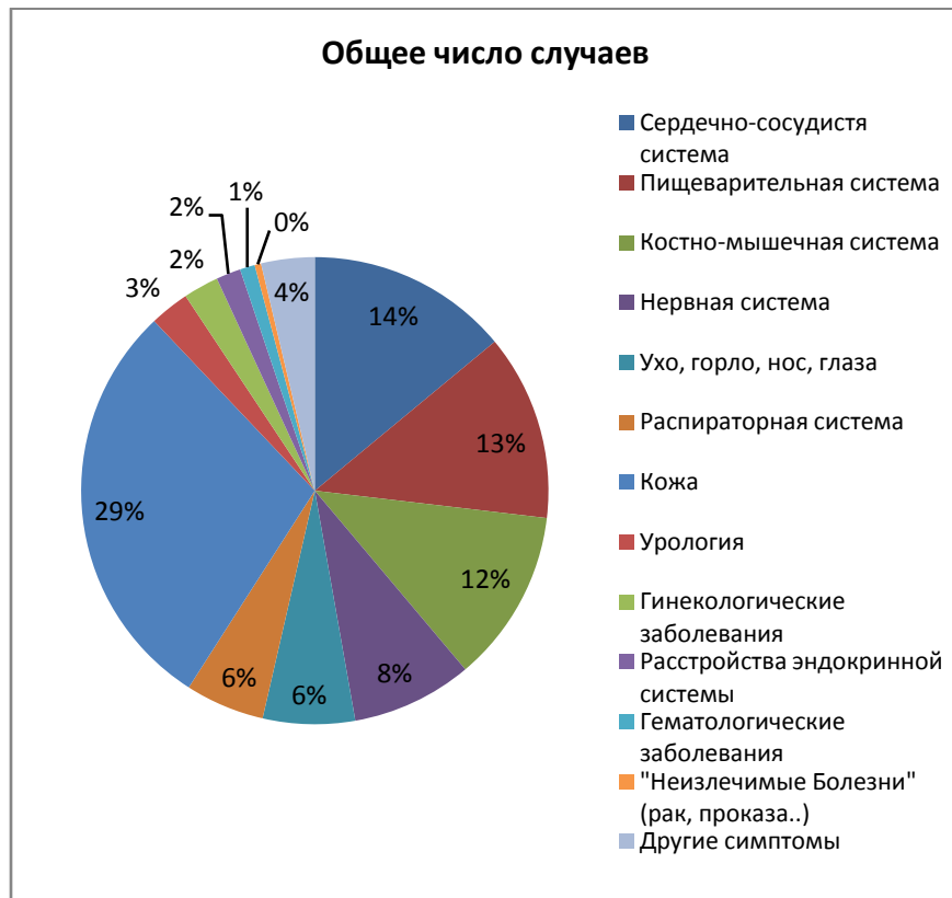
Таблица 2. Влияние Фалуныгун на излечение болезней